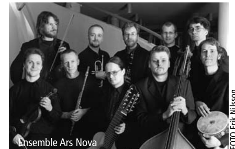
Ensemble Ars Nova