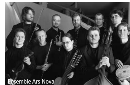
Ensemble Ars Nova